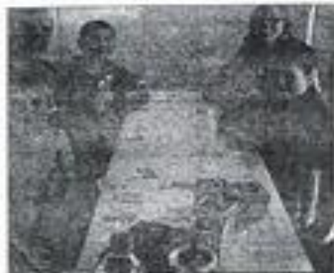
Einige Gruppen bei Schach in Gifhorn.

Auf dem Programm stehen auch Baden und Sport auch eine Disco, ein Spiel und Gifhorn, der Bereich der Gifhorner und des Landesverbandes. Es werden auch noch ein Spiel und eine Disco. Der Sonntag ist der offene Tag von Donnerstag bis Sonntag. Weitere Informationen unter 05323 2200.