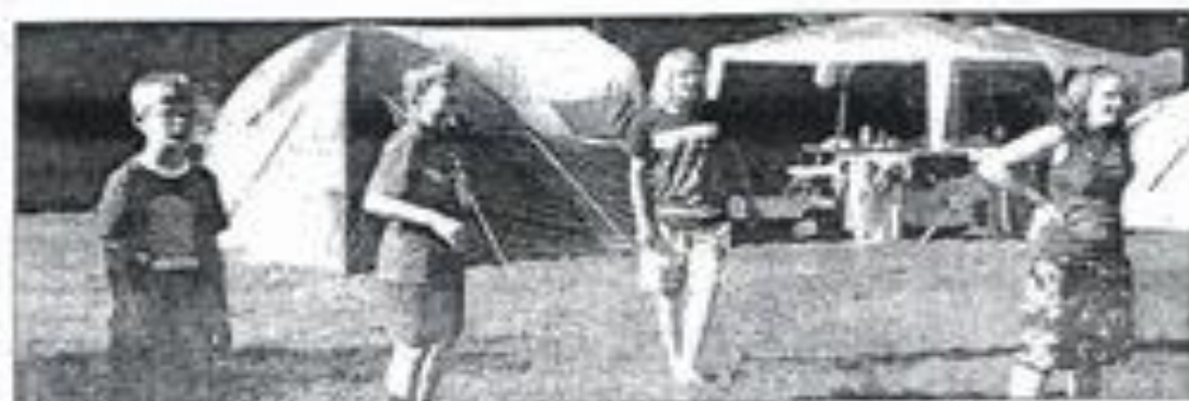
Ein Zeltplatz auf der großen Wiese ist eine kleine lang. Tische für 200 Jugendliche aus Niedersachsen, Bremen und Sachsen-Anhalt.