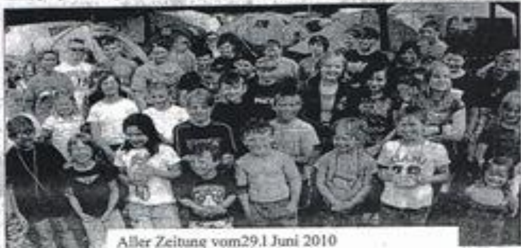
Aller Zeitung vom 29.1 Juni 2010

Die Jugendlichen von Gifhorn bis zum Landkreis kommen zu